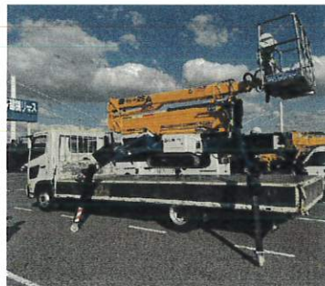
スタビライザー先端にアタッチメントを装着し、自力で4トン平トラックへ搭載可